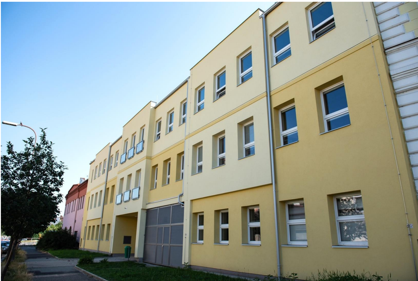
Přístavba s moderními odbornými učebnami