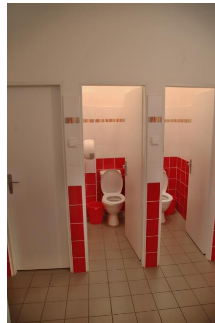
Modernizací prošlo i hygienické zázemí školy