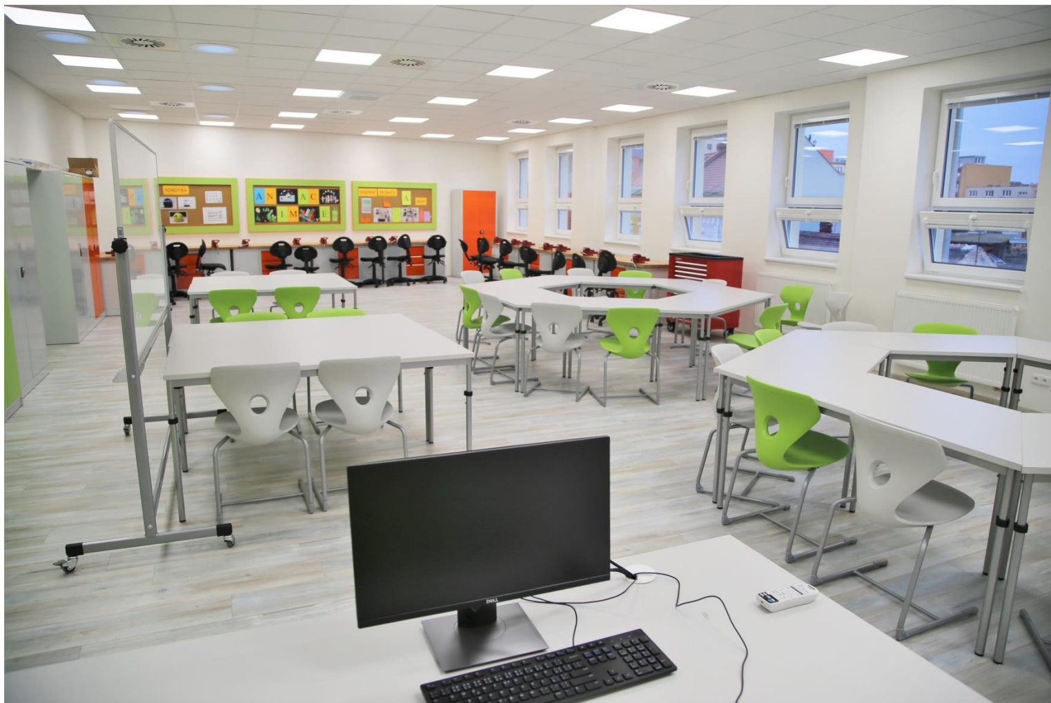
Pracovna technických předmětů