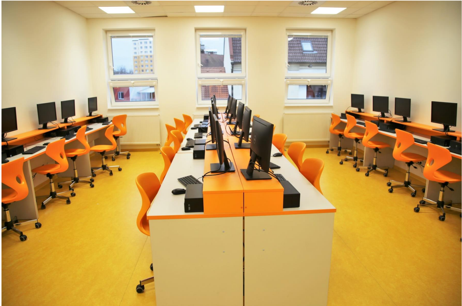
Pracovna Informatiky I