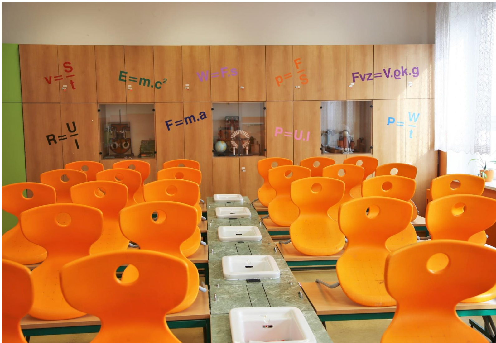
Pracovna přírodních věd