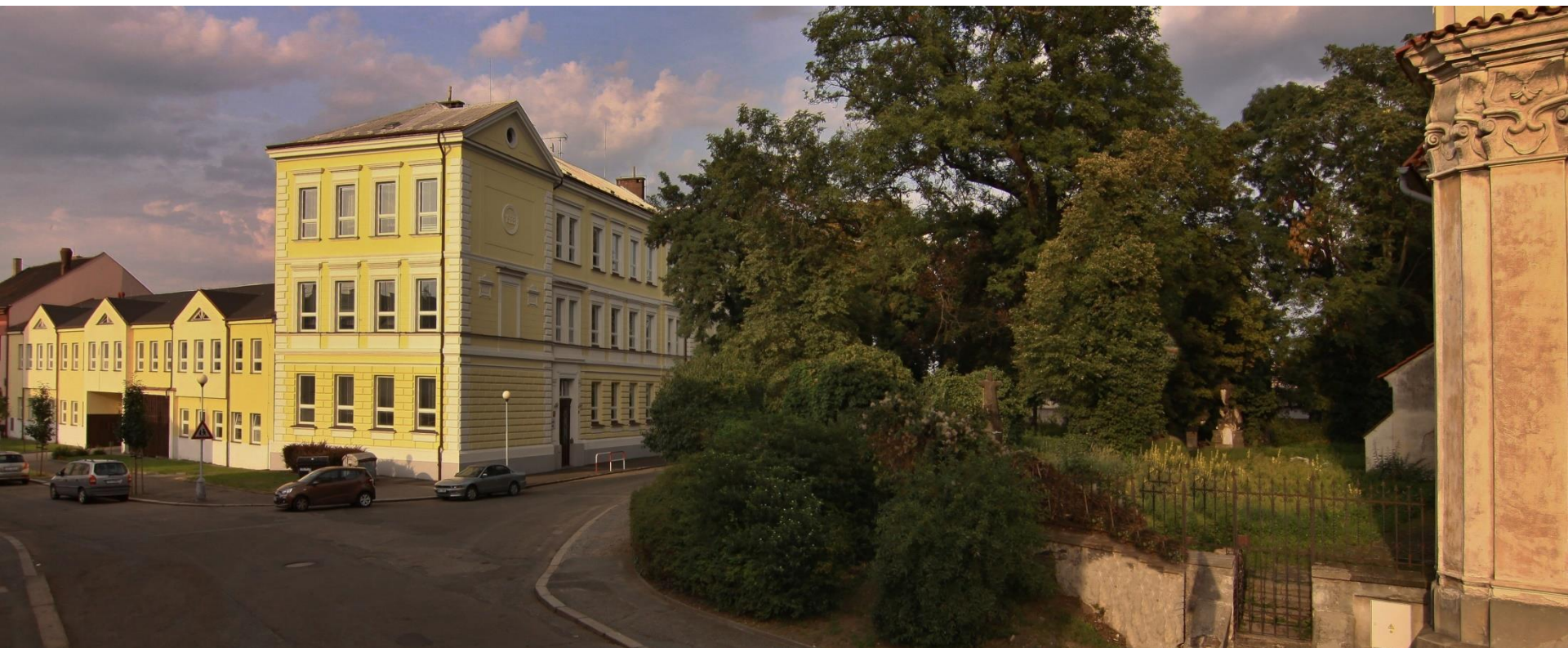
Základní škola Kolín V., Mnichovická 62 Kolín