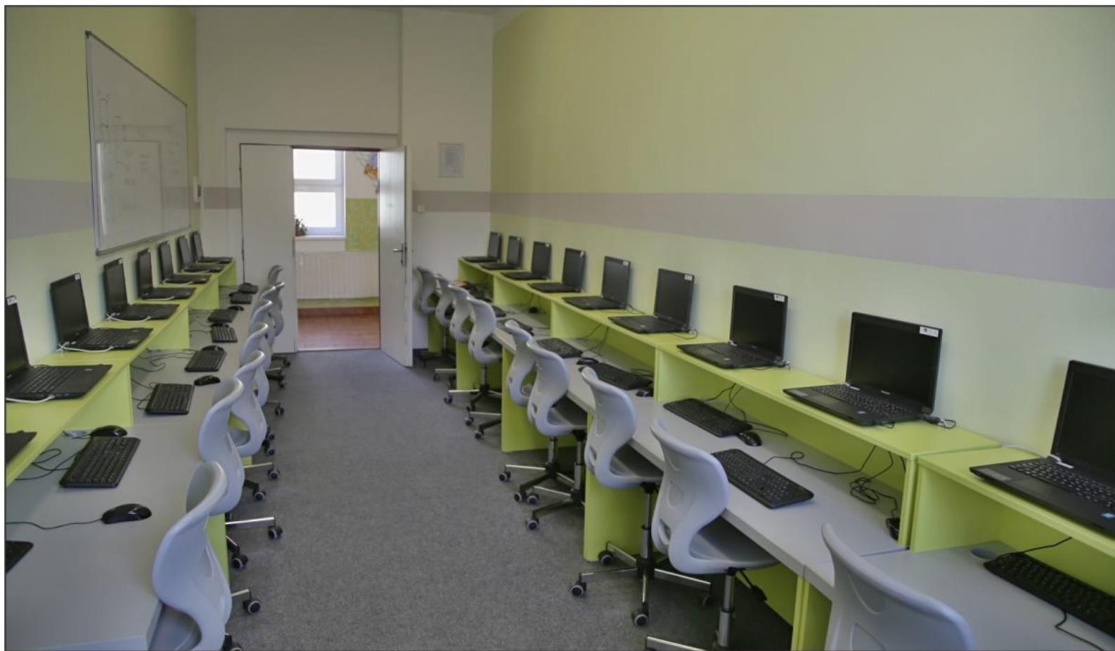
Mobilní počítačová učebna