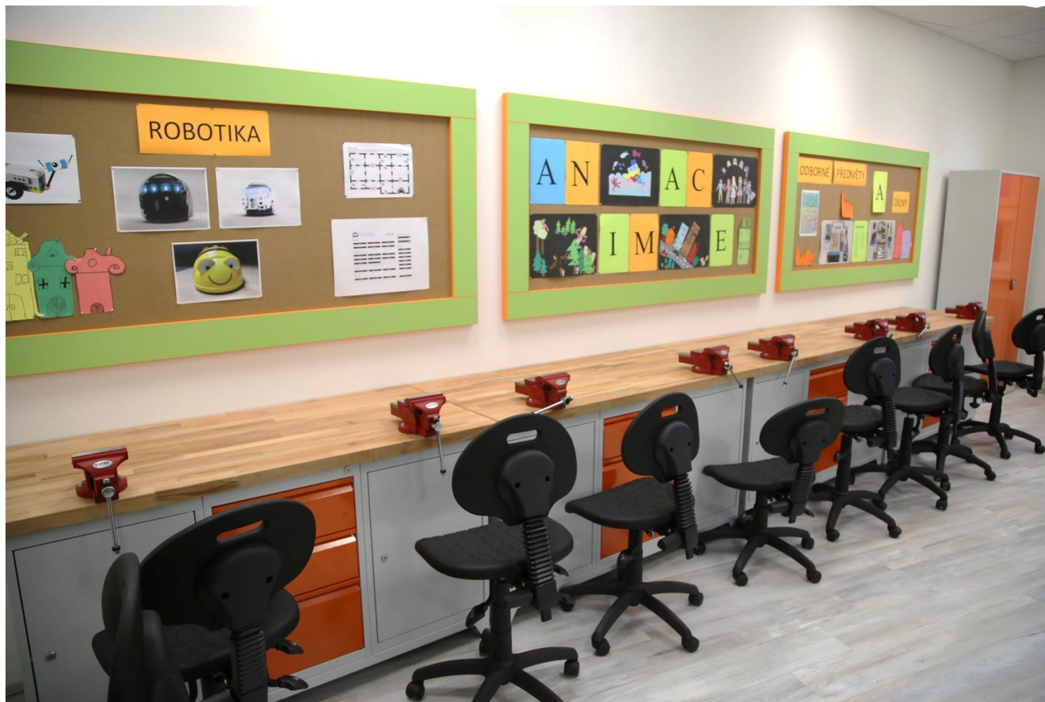
Odborná pracovna - dílny