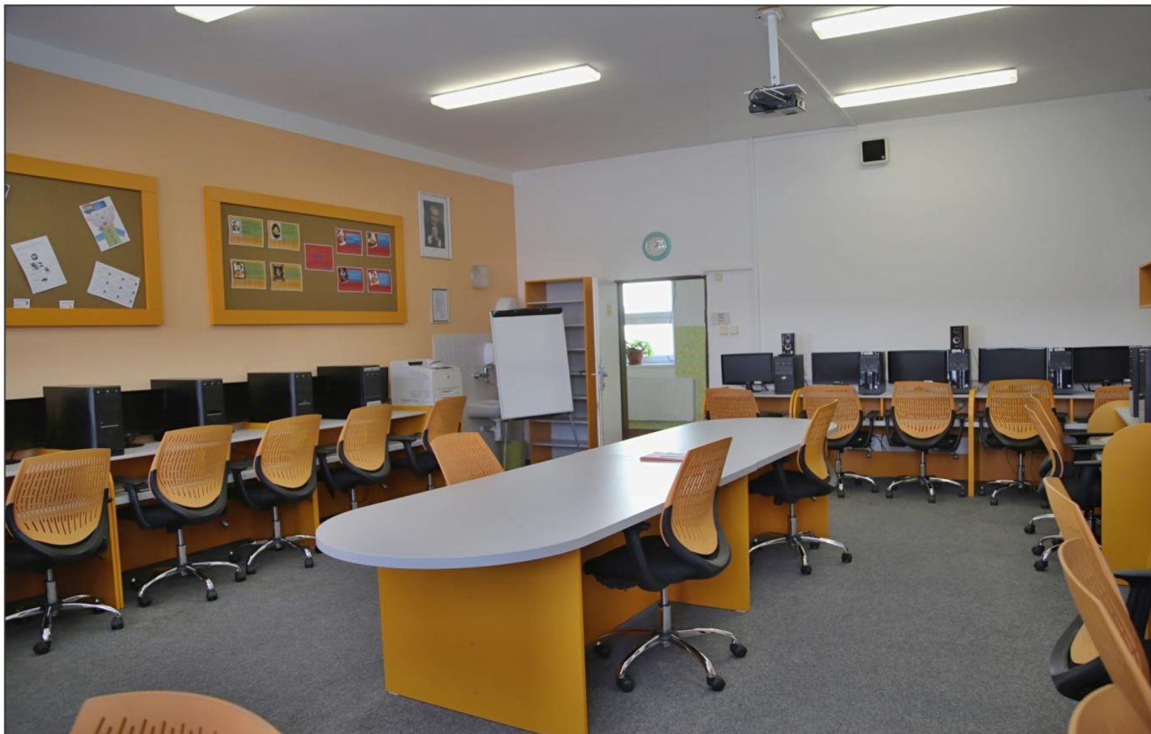
Pracovna Informatiky II