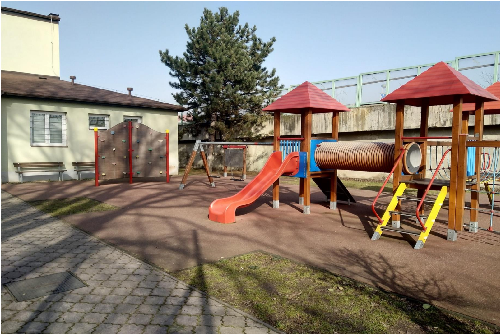
Venkovní víceúčelové hřiště