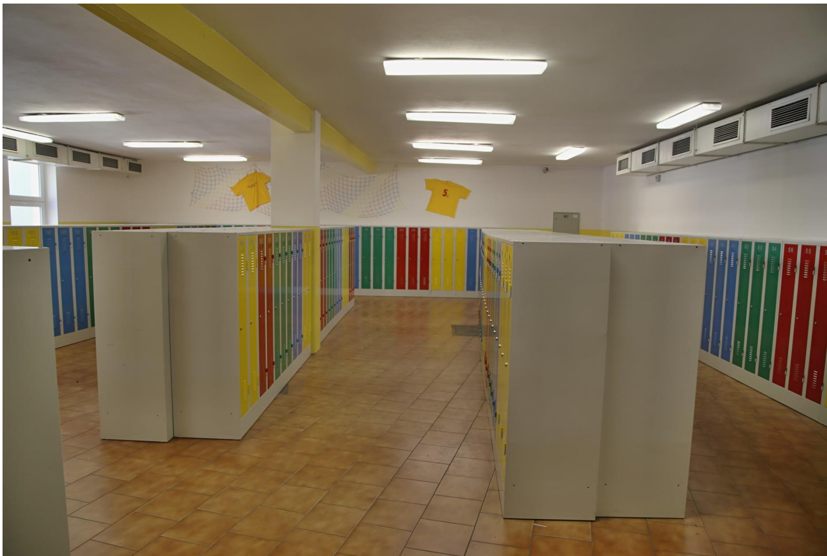
Šatny pro žáky II. stupně