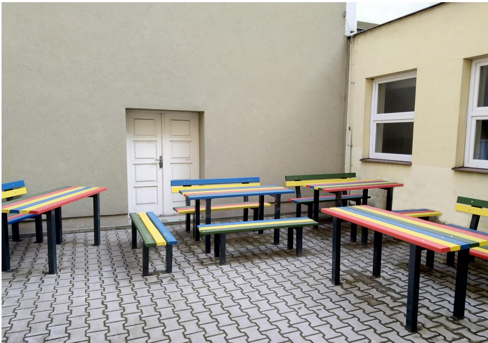
Učebna v „atriu“ školy