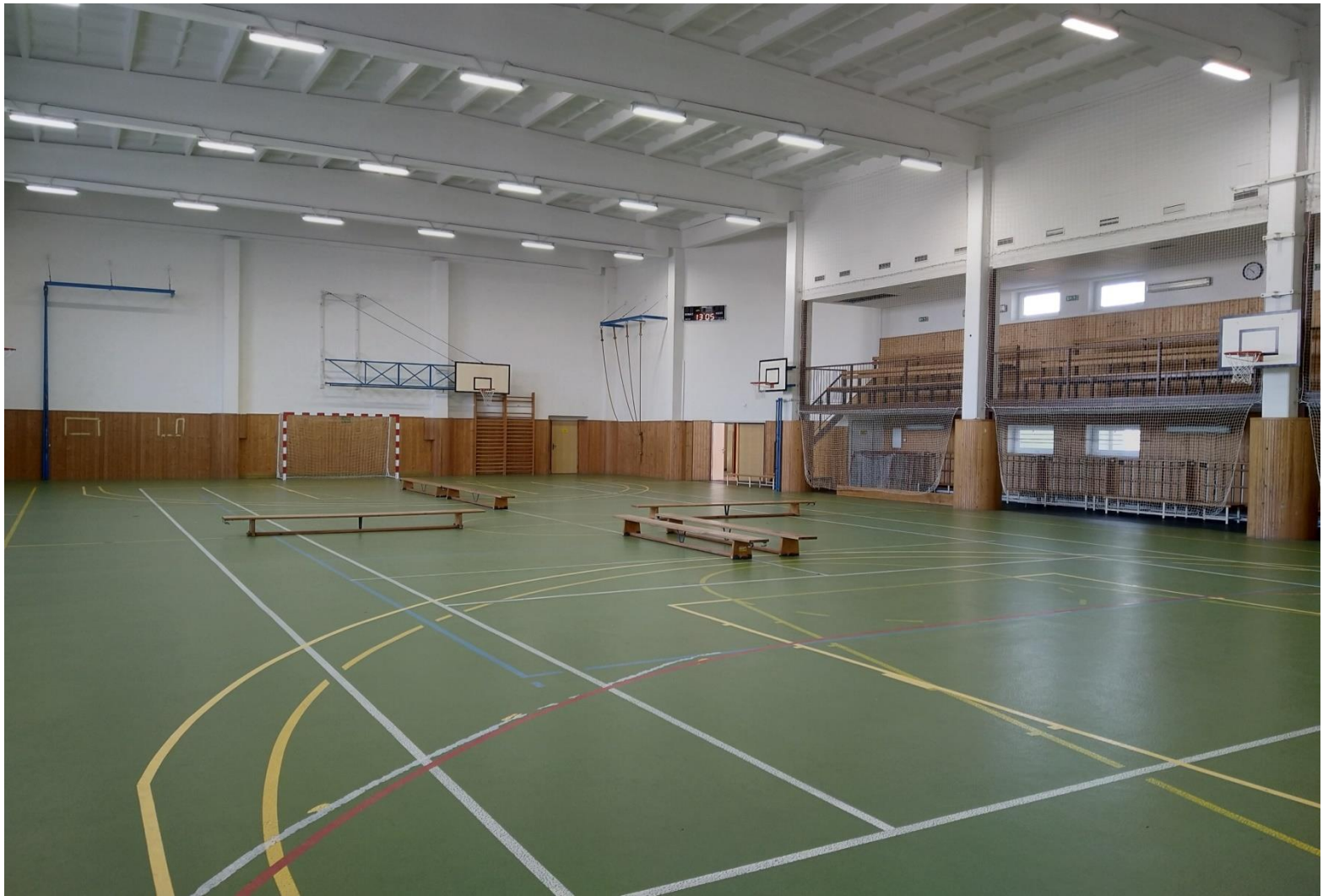
Moderní víceúčelová tělocvična se zázemím